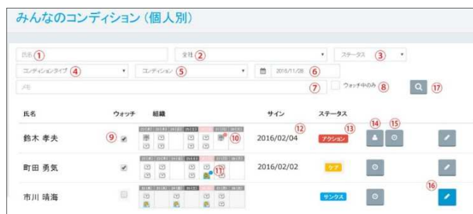
②「みんなのコンディション」画面